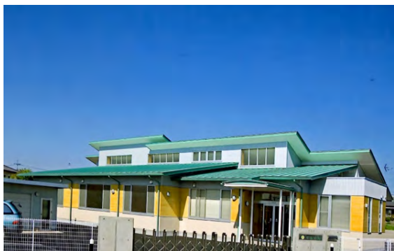
生活介護事業所「あじさい」全景