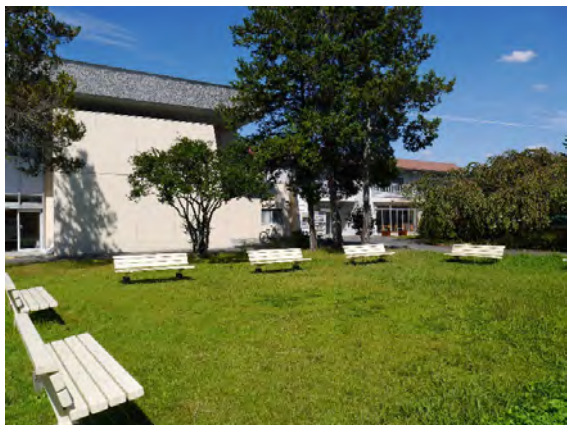
学生食堂前の広場