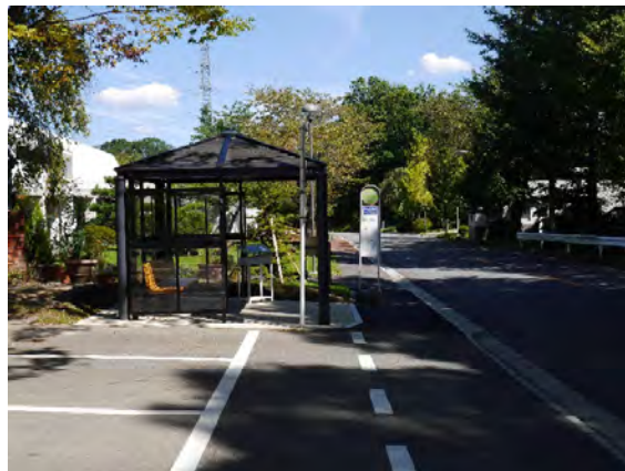
バス停「のぞみ大学前」