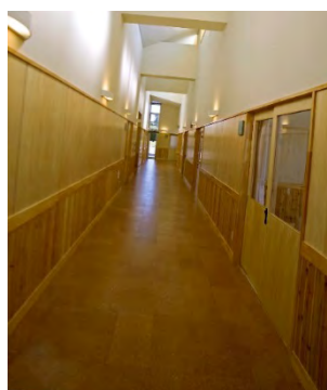
廊下（静養室⇔作業室）