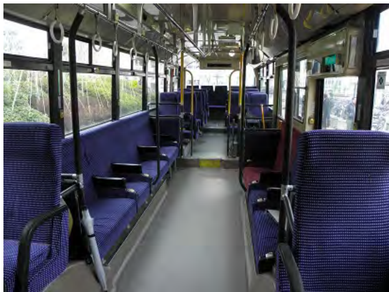
「のぞみ大学」行きのバス車内